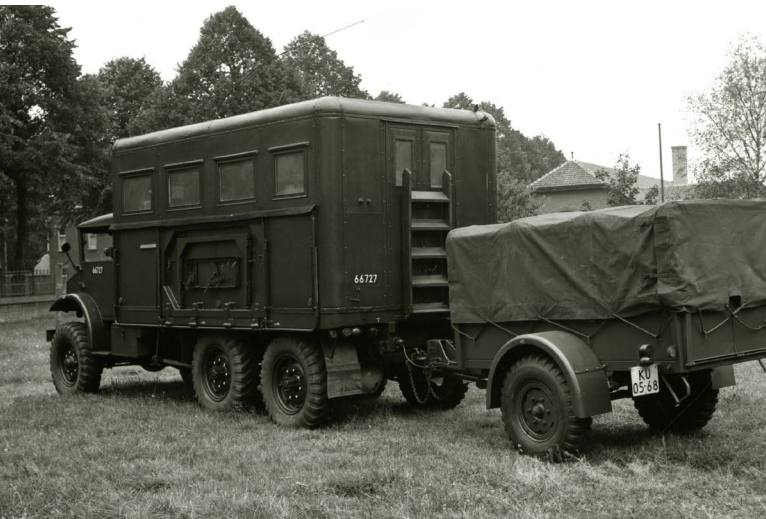
Werkplaatsauto 103 Vbdd Bagr

Het B-peloton van 110 bevond zich onder de Moerdijk. Deze eenheid was voortgekomen uit de voormalige Gewestelijke RIMI Hoofdwerkplaats Zuid te Tilburg en was opgericht op 20 november 1952. Op 1 oktober 1954 werd de naam gewijzigd in 116 Verbindingsdienst Basis Herstel- en Depot Compagnie. Er waren ook nog plannen voor een C-peloton van 110 Verbindingsdienst Herstel Compagnie, maar die zijn nooit gerealiseerd.