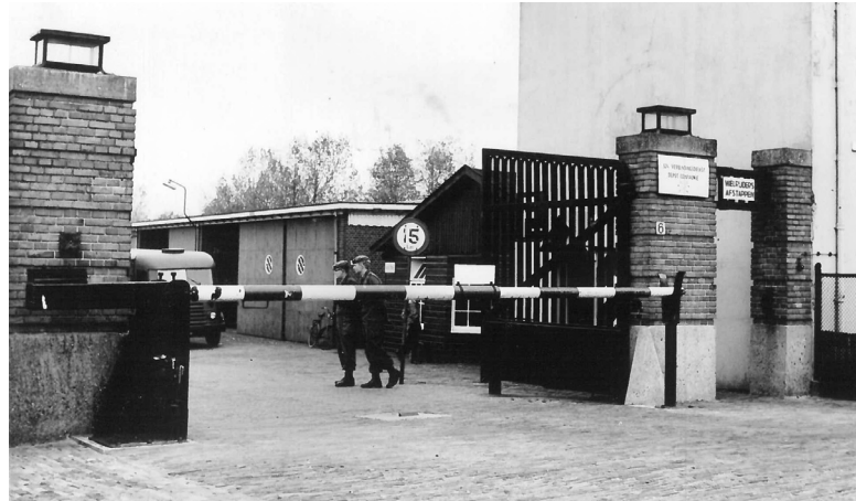
524 Vbdddepcie Delft

Per 1 oktober 1954 was het Basiscommando operationeel. Alle eenheden die daaronder vielen, moesten het woord 'basis' opnemen in hun naam.